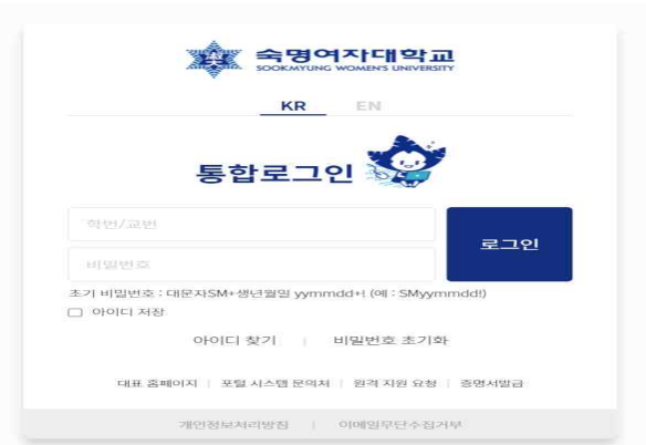
숙명포털시스템 학사 전반에 대한 정보를 제공하는 곳