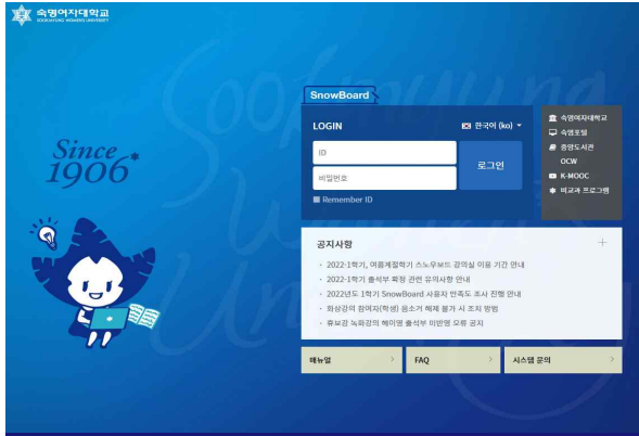
SnowBoard(학습관리) 금학기에 수강신청한 과목들의 온라인 강의실