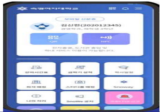
헤이영(APP) 숙명 모바일 서비스 종합 어플리케이션